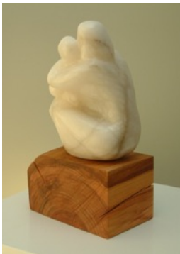
"Amore materno", "Moederliefde"

Persoonlijk ervaar ik Albast als een steen die door bewerking - zoals raspen en schuren - haar binnenste laat zien. Het " binnenste-buiten " doordat de huid transparant wordt en als het ware gaat leven in je handen en laat zien wat er binnen in de steen speelt.